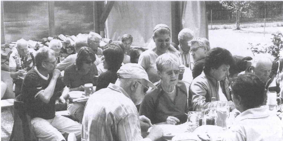
Dank professioneller Bewirtung durch die „Hundefreunde“ war es zünftig und gemütlich !

Selbst grau verhangener Himmel konnte Freude bei der Zwei-Tages-Radtour nicht trüben