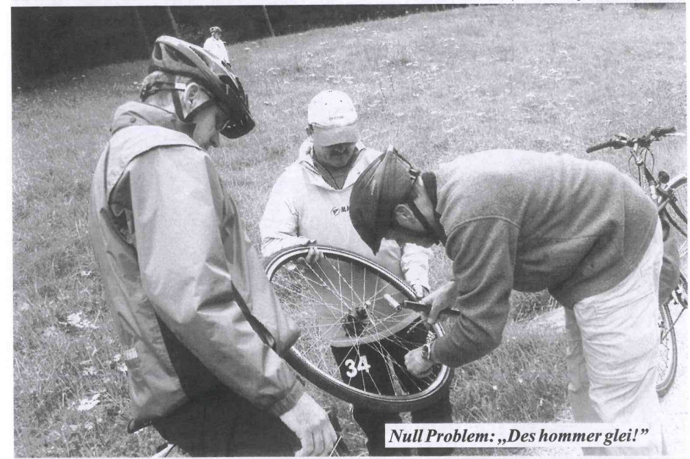
Null Problem: „Des hommer glei!“